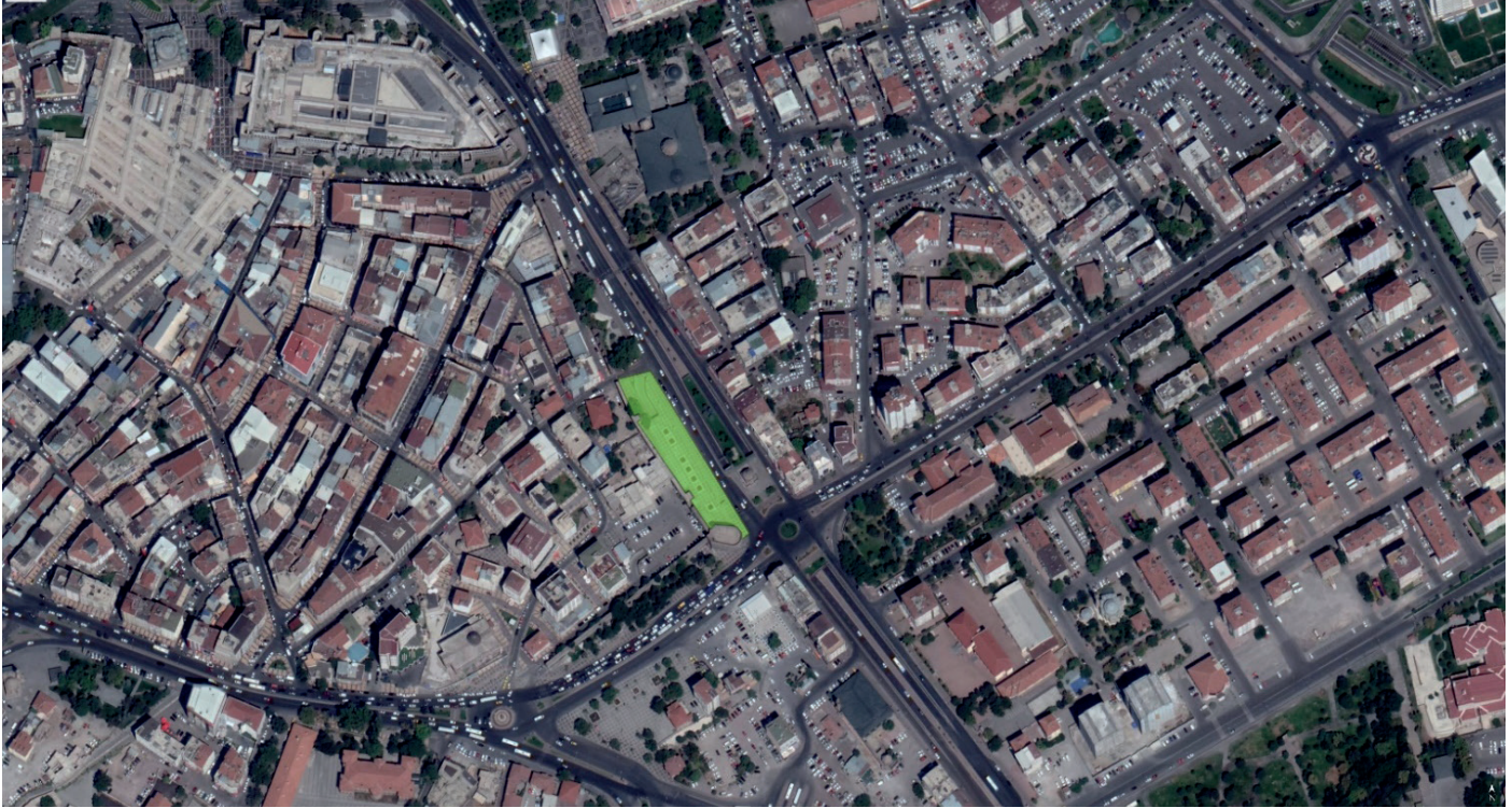
Resim 2. Yarışma alanına ait uydu fotoğrafı (yeşil renk ile taralı alan yarışma alanı sınırlarını göstermektedir.)

Kayseri Büyükşehir Belediyesi ve Melikgazi İlçe Belediyesi sınırları içinde olan yarışma alanı, Seyyid Burhaneddin Bulvarı ile Kayseri dış kale surları arasında kalan, surlara paralel uzanan alandır. Diğer bir anlatımla, Seyyid Burhaneddin Bulvarının güneybatısında, Yoğunburç Caddesinin kuzeybatısında, Seyyid Burhaneddin Bulvarının ve Yoğunburç Caddesinin kesiştiği noktada yer alan Yoğunburç Kavşağı ve Alaca Kümbet karşısında, dış kale surlarına ve Seyyid Burhaneddin Bulvarına paralel uzanan kapalı otopark alanının üzerinde kalan kısım yarışma alanı olarak belirlenmiştir. Bu alan, şartname eki, "5. Uydu Fotoğrafları ve Yarışma Alanı" dosyası üzerinde işaretlenmiştir.