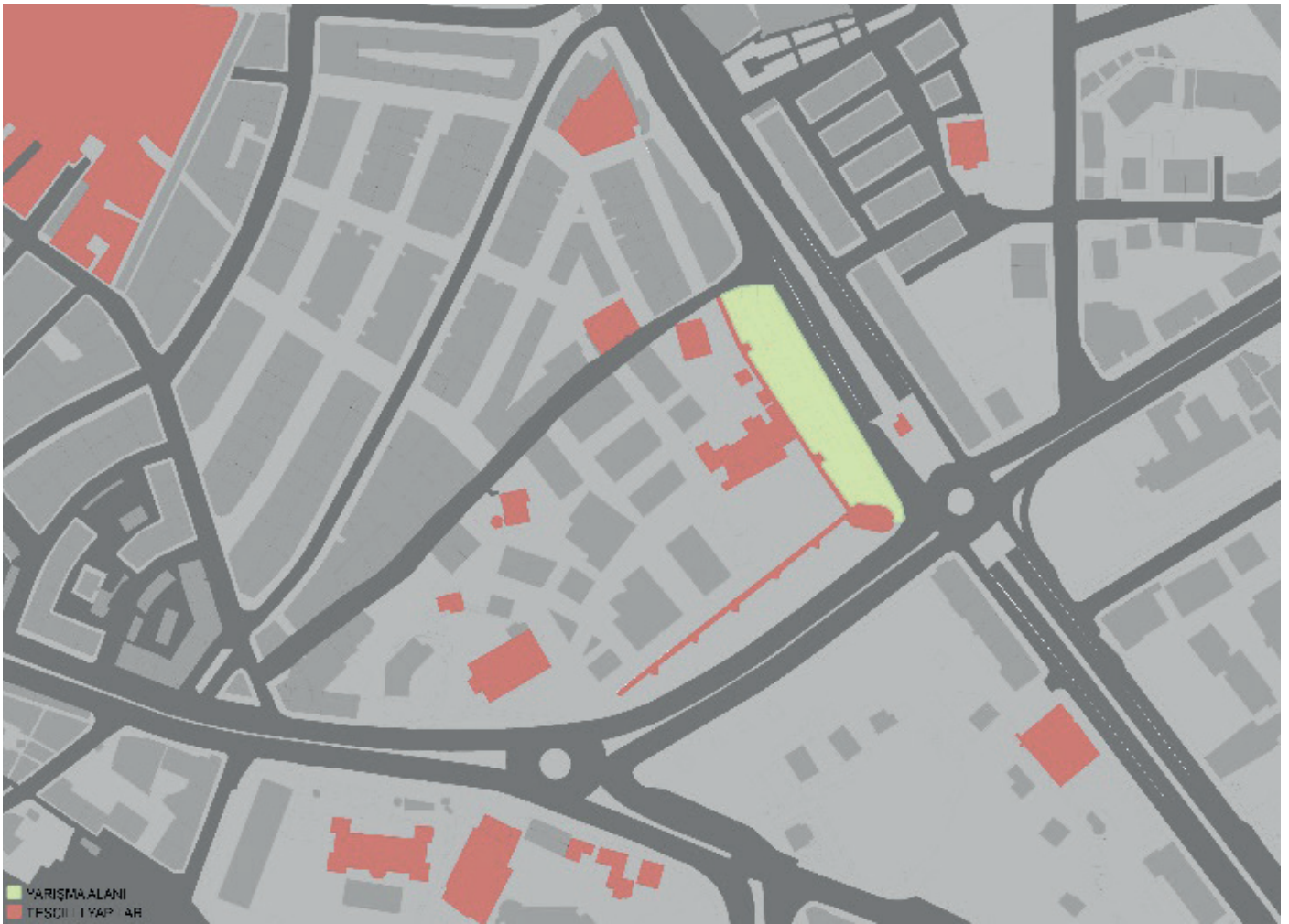
Resim 4. Yarışma alanı ve yakın çevresi

Yarışmaya katılmak isteyenler yarışma adını “Kayseri Melikgazi Buluşma Noktası Ulusal Fikir Yarışması” açıklaması ile 100 TL’yi (Yüz Türk Lirası) idari iletişim bilgilerinde verilen banka hesabına yada elden Melikgazi Belediyesi tahsilat veznelerine isim bilgisi ile yatıracaktırlar. Yarışmacılar, şartname bedelini yatırdıklarına dair banka ödendi belgesinin taranmış kopyasını, adı, soyadı, açık posta adresi, telefon, faks ve e-posta adresleri ile birlikte yarışma raportörlüğü e-posta adresine ( yarisma@melikgazi.bel.tr ) göndererek kaydettireceklerdir. Yarışma şartnamesi ve ekleri iletişim bilgileri bölümünden verilen adresten dijital olarak indirilebilecektir. Yarışma şartnamesi almak için son tarih, yarışma takviminde projelerin teslimi olarak belirtilen gündür. Bu şartlara uymayanlar yarışmaya katılmış olsalar da projeleri yarışmaya katılmamış sayılır.