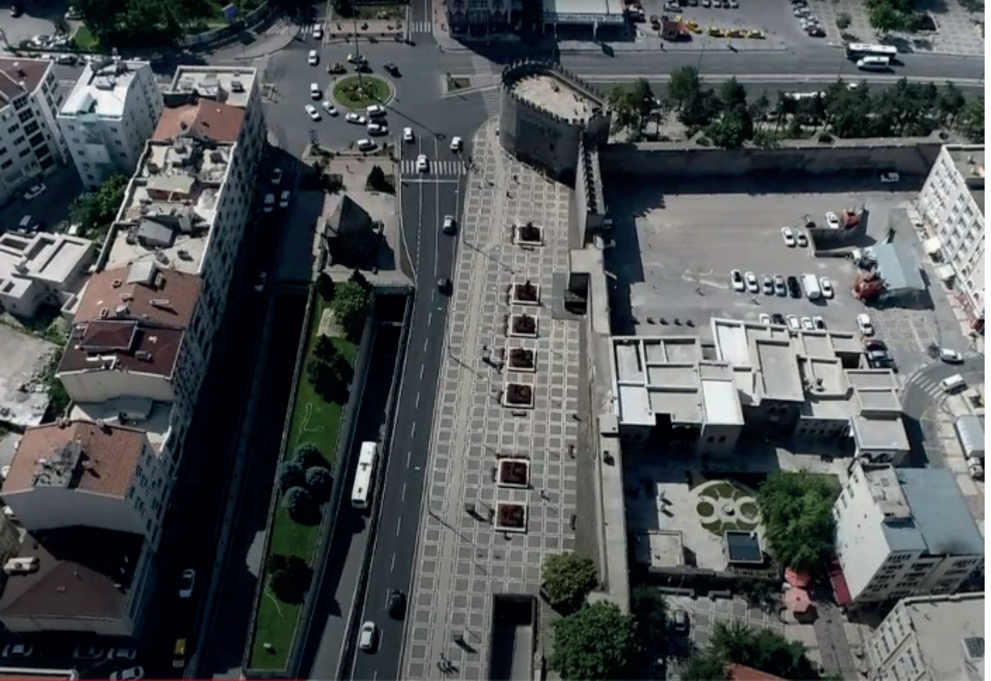
Resim 1. Yarışma alanı ve yakın çevresi

Kayseri Melikgazi Belediyesi ve TMMOB Mimarlar Odası Kayseri Şubesi kolektif katılımıyla duyuruya açılan "KAYSERİ MELİKGAZİ BULUŞMA NOKTASI ULUSAL FİKİR YARIŞMASI" ile, kentte yaşayanların yarışma alanı olarak belirlenmiş bölgede buluşmalarına olanak sağlayan, yerin özellikleri üzerinden geliştirilmiş, şu anda atıl olan alanın kullanımına farklı işlevler getirecek çağdaş ve yenilikçi tasarımlar üretilmesi amaçlanmaktadır. Yarışma konusu çerçevesinde, güzel sanatların teşviki, kültür, sanat, bilim ve çevre değerlerinin rekabet yoluyla geliştirilmesi ve ilgili mesleklerin gelişmesi için uygun ortamın sağlanması amaçlanmaktadır.